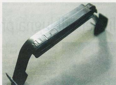
När handtaget är låst fungerar det som vilket handtag som helst. När man snäpper loss en hake blir det en våg.